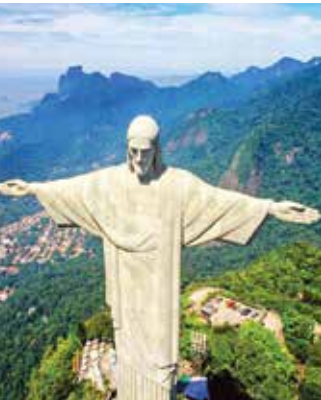
[ مجسمه مسیح منجی، ریودوژانیرو، برزیل ]

قرآن کریم از حضرت عیسی مسیح(ع)با عظمت یاد کرده و با عنوان بلندی همچون «کلمه الله» و «روح الله» نام می‌برد. آن حضرت یکی از پیامبران اولوالعزم است که ولادتش با معجزات بزرگی همراه بود که ترویج صلح و دوستی و بخشش و دیگر خواهی در فضای اصالت منافع وزراندوزی کاهنان و احباراز جمله بزرگترین آن است. روز وسال میلادش مبدأ محاسبه سال برای تقویم مسیحی محسوب می‌شود. میلاد حضرت عیسی مسیح(ع)آغاز دگرگونی در عرصه روابط انسانی و بازگرداندن کرامت و شرافت انسانی به بشریت است، زیرا آن حضرت در شرایطی یا به عرصه وجود نهاد که خودخواهی و آز و ظلم قوم یهود انسانیت انسان را مقهور خود ساخته و نطفه الهی ازسنگینی مصائب آن فرصتی برای تجلی و ظهور نمی‌یافت.مهم‌ترین ویژگی حضرت عیسی مسیح(ع)که قرآن کریم برآن تکیه می‌کند، بندگی خداوند و مأموریت آن حضرت برای ابلاغ پیام توحید و یگانه پرستی است.از این‌و کلام وحی از او با تعبیری همچون اصفطاء(آل عمران ۴۹)و اجنباء و از جمله صالحان (انعام/۸۵- ۸۷) نام می‌برد.همچنین خدای تعالی او را مسیح نام