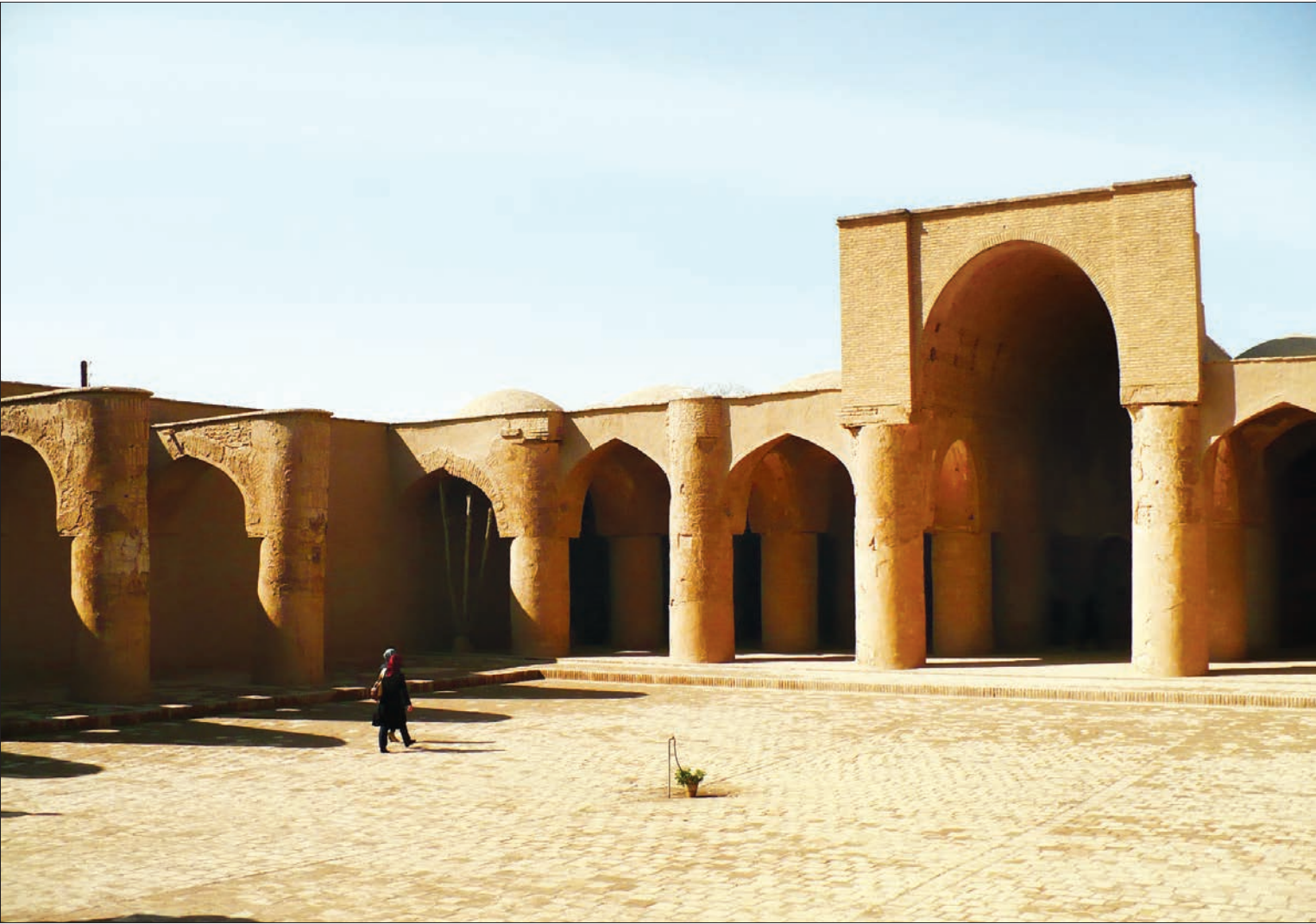
روشنایی در تاریخانه

نخستین بار گذار بود که با مقاله‌ای مفصل در نشریه هنرهای زیبای فرانسه در سال ۱۹۳۴ میلادی نام تاریخانه را وارد ادبیات معماری جهان کرد و پس از آن در جلد سوم کتاب «بررسی هنر ایران» پوپ با موضوع هنر اسلامی نیز شرحی ارائه داد.