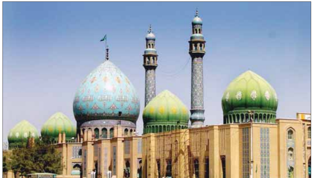
سال ۲۰۰۸، سالی برای میراث دینی و اماکن مقدس