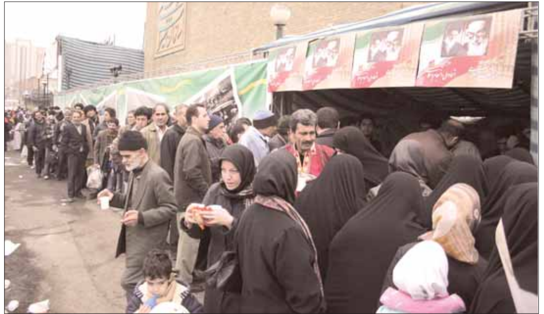
پذیرایی از راهپیمایان ۲۲ بهمن در ایستگاه سازمان