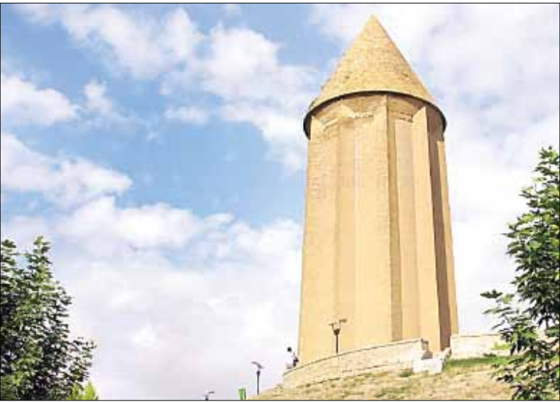
گنبد کاووس

نگاهی به دو گزینه جدید ایران در فهرست میراث جهانی یونسکو