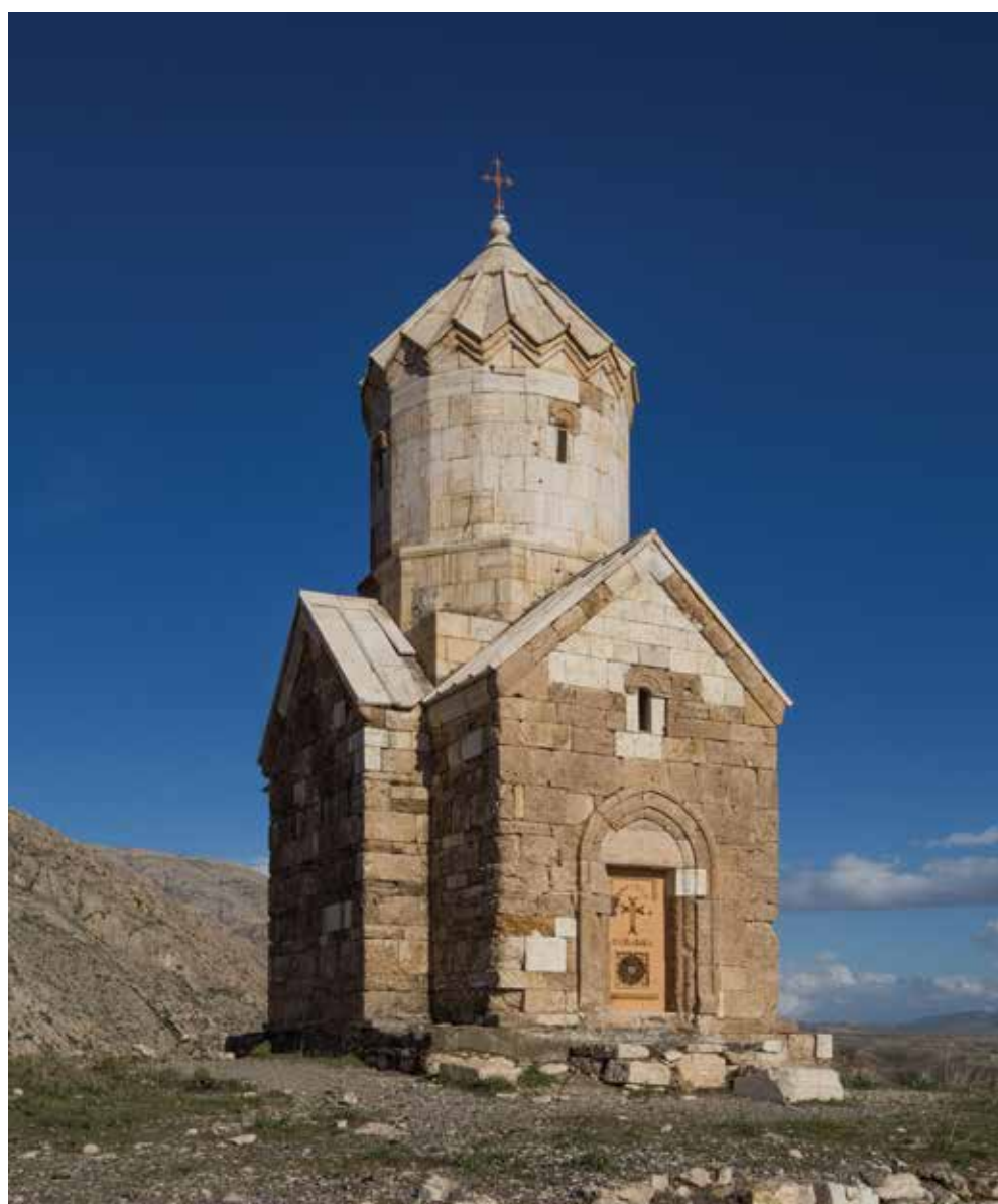
زر زر؛ کلیسایی که جایجا شد

۱۲۴۳ میلادی در کتب مذهبی و تاریخی گونان دیده می‌شود، در شمال دشت چالدران، در منطقه‌ی کوهستانی آذربایجان غربی و تحت نظارت شورای خلیفه‌گری ارامنه‌ی آذربایجان در تبریز واقع شده است. این کلیسا همان «قره کلیسا» است. این نام، که برگرفته از سنگ‌های سیاه‌رنگی است که در ساخت بخش قدیمی‌تر کلیسا استفاده شده، شهرت بیشتری نزد عوام دارد. «قره» در زبان آذری به معنای سیاه است و از طرفی در زبان ارمنی «گاره» یا «گارا» به معنی بزرگ است. بنابراین با توجه به عظمت کلیسا، عنوان «گارا کلیسا» نیز می‌تواند به آن اطلاق گردد.