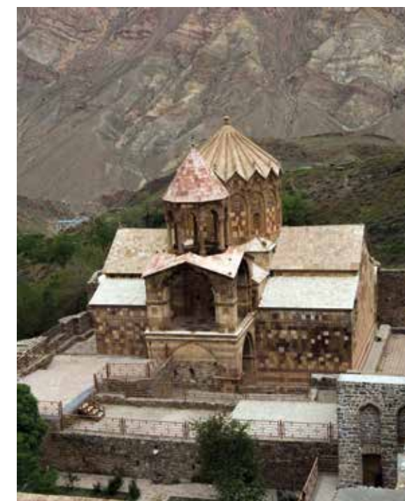
سنت استپانوس؛ کلیسای آرامیده در دامنه کوه‌های چلفا

در خصوص تاریخ ساخت این بنا روایت‌های مختلفی وجود دارد. برخی از مورخان ارمنی معتقدند این دیر توسط یکی از ۱۲ حواری حضرت عیسا به نام «پارتولومئوس مقدس» در همان قرن اول میلادی بنا شده است، و این هنگامی است که بعد از رستاخیز