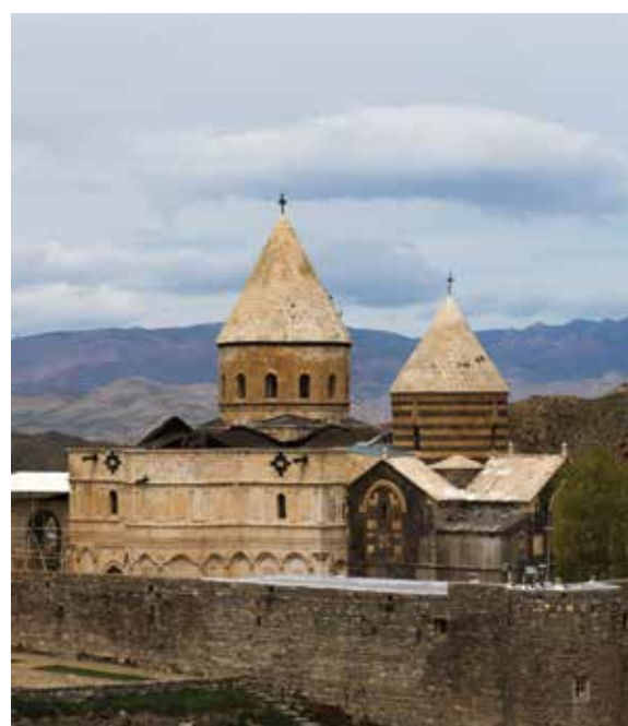
تادئوس؛ نگین چالدران